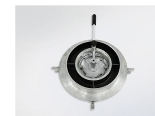
Držák navařovacího svazku (opce)