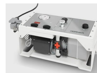
Všechny přípojky na zadní straně