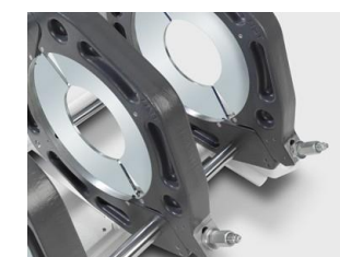
Ocelové redukce se šroubovým upevněním