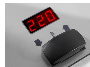
Centrální regulace teploty skříňky

Na všechny komponenty se vztahuje záruka HÜRNER!